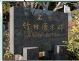
泉水湧水の入口にある碑