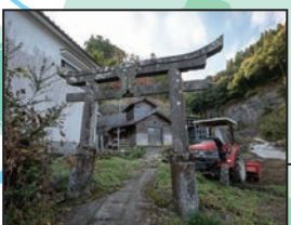
鳴瀧の入口に立てられた「鳴瀧神社」の鳥居