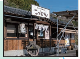
竹田の中華そばごっこん