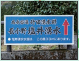
塩井湧水水源への案内看板