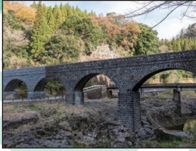
明正井路 第一拱石橋