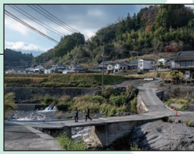
川の流れを間近に感じられるスポット